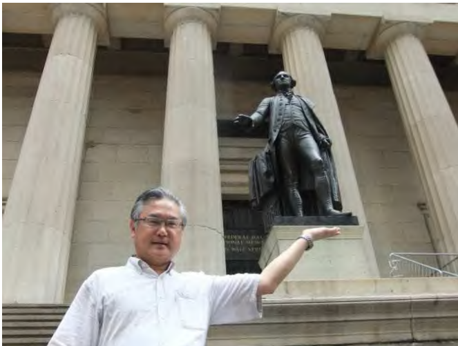
ジョージ・ワシントン像／フェ デラルホール@ウォール街