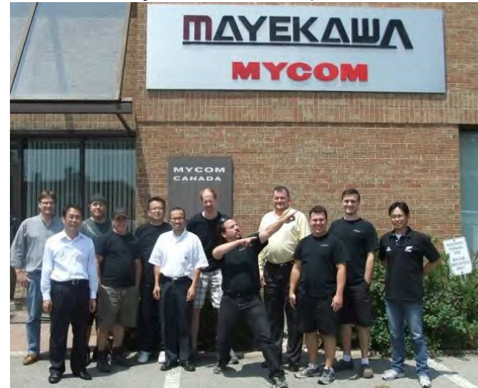
冷凍機単体の販売が年平均200台の売上有る。