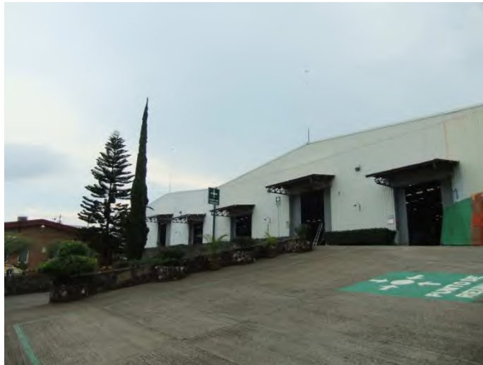
鑄造工場も活気にみなぎっていた。