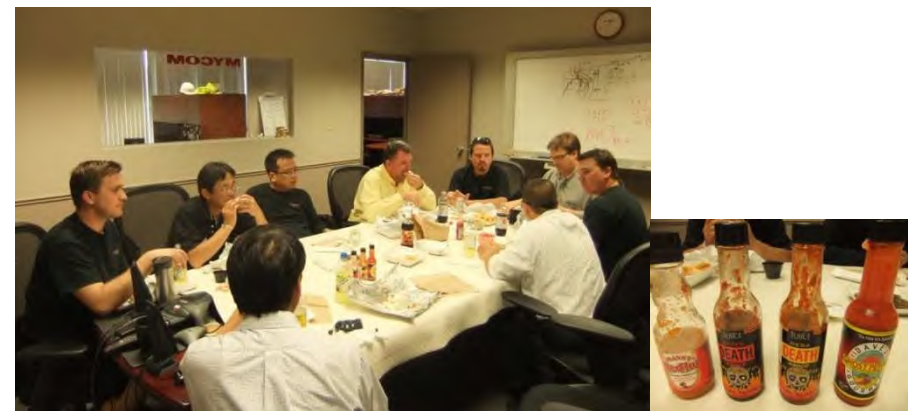
月に一度の昼食会、辛い香辛料に参りました。