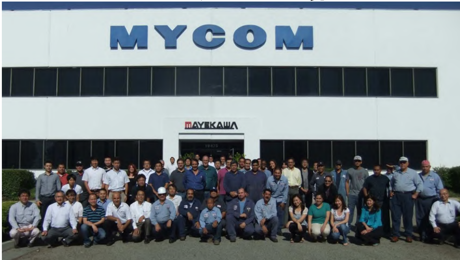
購買・業務メンバー