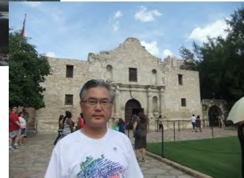
アラモの砦@サンアントニオ