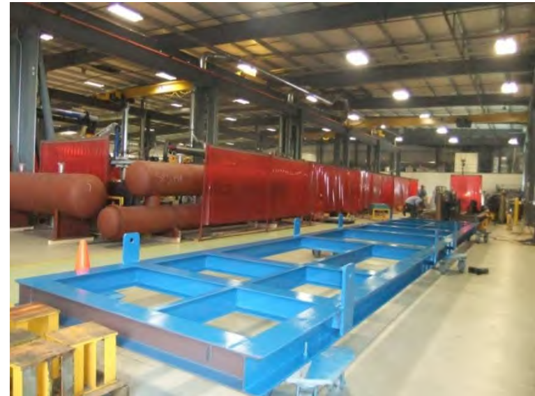
今年の出荷台数は200台を予定。