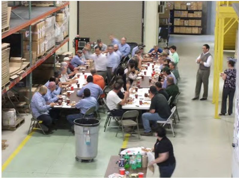
テネシー工場／昼食会の一コマ