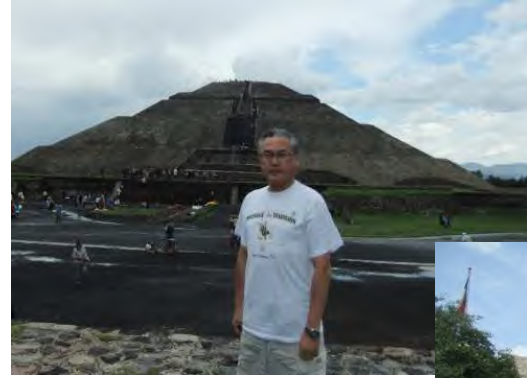
太陽のピラミッド @メキシコ