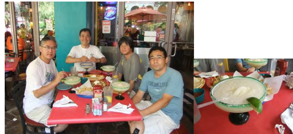
マルガリータ・テキサスサイズ@サンアントニオ